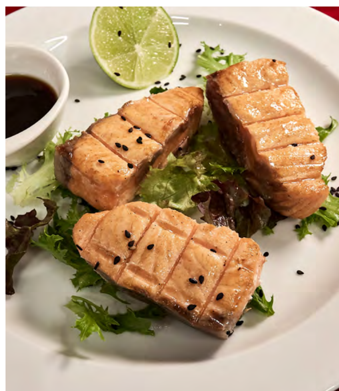
ШАШЛЫК ИЗ СЁМГИ