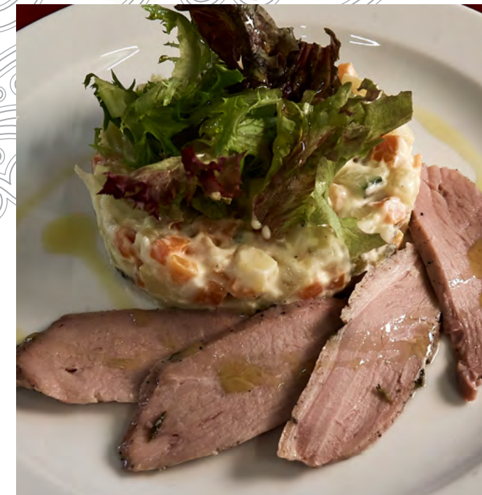
ОЛИВЬЕ С УТИНОЙ ГРУДКОЙ

салат айсберг, куриное филе, заправка цезарь, сухарики, томаты черри, сыр пармезан 210 г