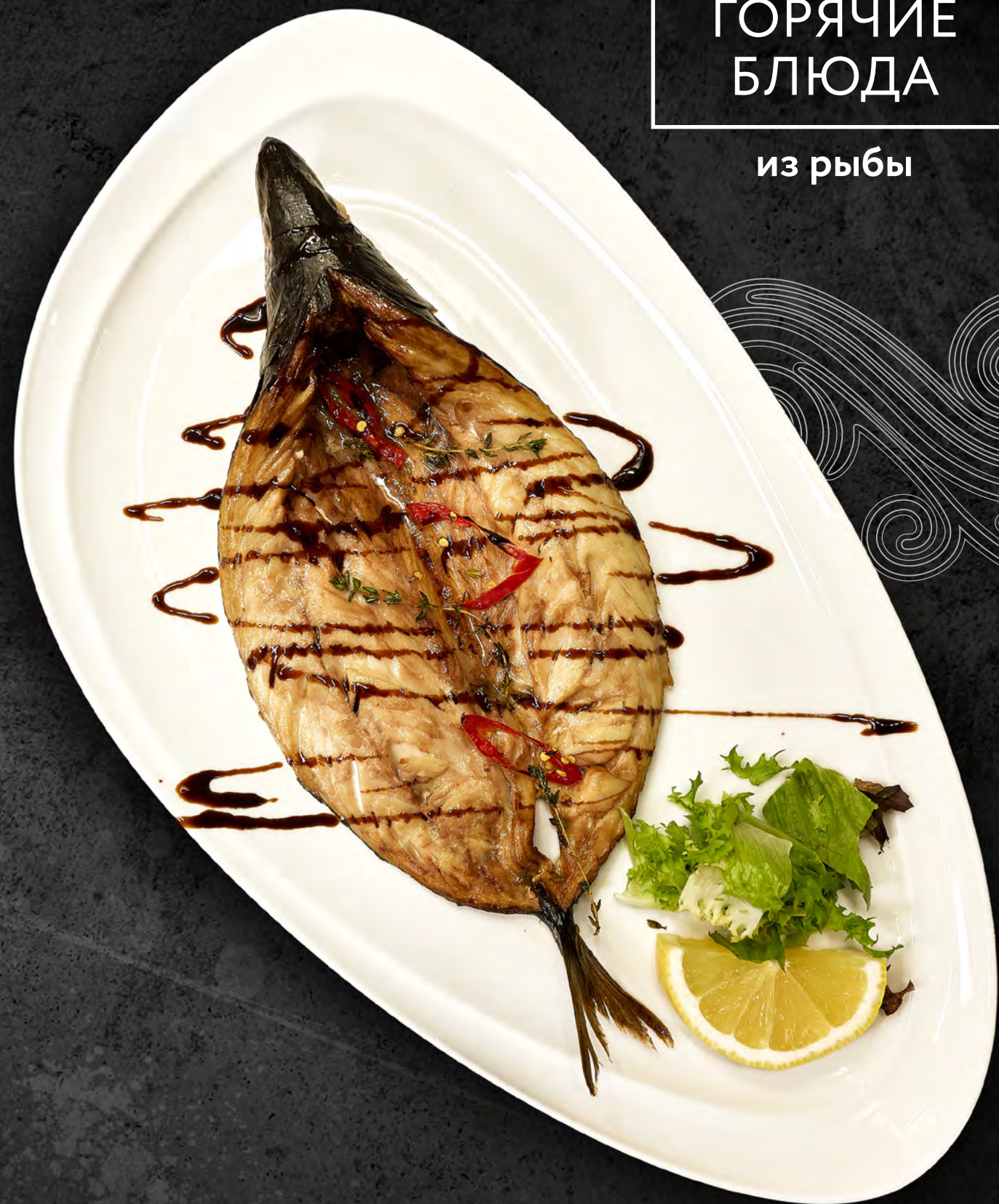
СКУМБРИЯ «МАКРЕЛЬ» ЗАПЕЧЕНАЯ