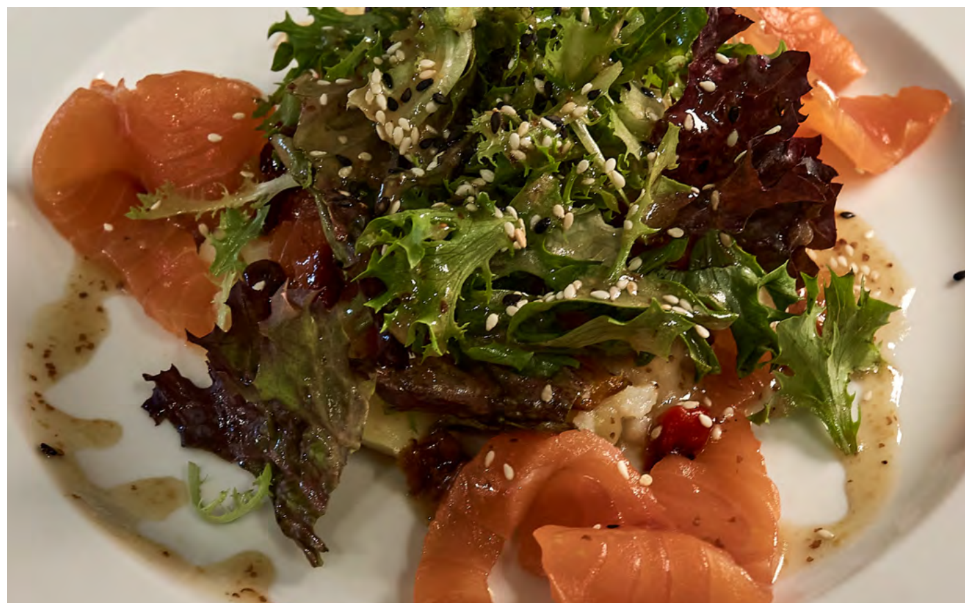
ЛОСОСЬ С ПЕЧЕНЫМ ПЕРЦЕМ НА ЛИСТЬЯХ САЛАТА