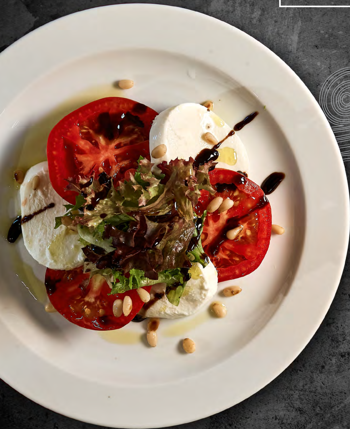
КАПРИЗЕ С СЫРОМ МОЦАРЕЛЛА И СЛАДКИМИ ТОМАТАМИ