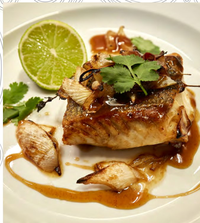
МОРСКОЙ СУДАК В АЗИАТСКОМ СТИЛЕ

морской судак, жареные овощи, соус терияки с белым вином 210 г