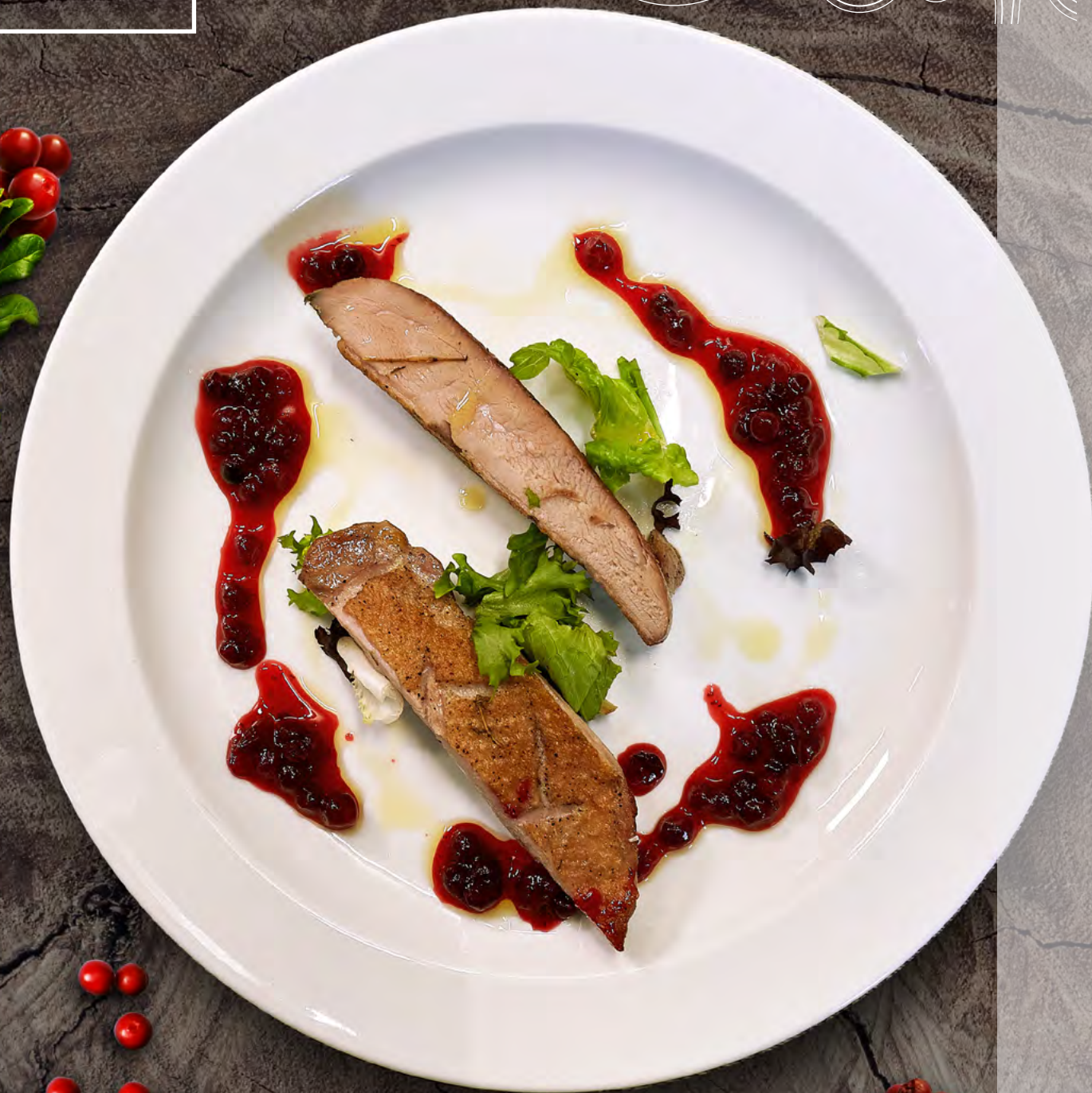
УТИНАЯ ГРУДКА С БРУСНИЧНЫМ СОУСОМ