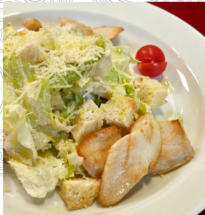
ЦЕЗАРЬ С КУРИЦЕЙ